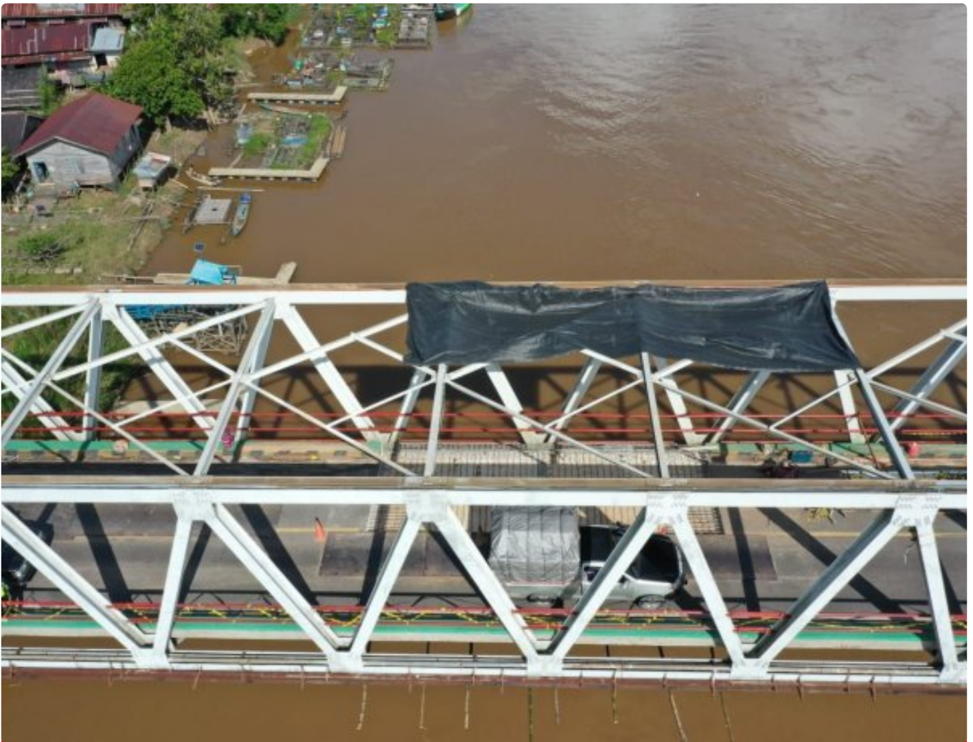
Jembatan Kasongan (Sei Katingan) Dalam Proses Perbaikan Oleh BPJN Kalimantan Tengah

KATINGAN - Penutupan jembatan Sei Katingan atau jembatan Kasongan, Kabupaten Katingan yang direncanakan akan ditutup pada tanggal 27 Maret 2023, akan diundur dua hari yaitu pada tanggal 29 Maret 2023.